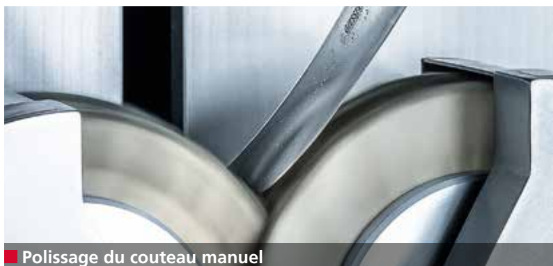
■ Polissage du couteau manuel

L'affûteuse E 50R affûte de manière entièrement automatique des couteaux à main de diverses formes et tailles.