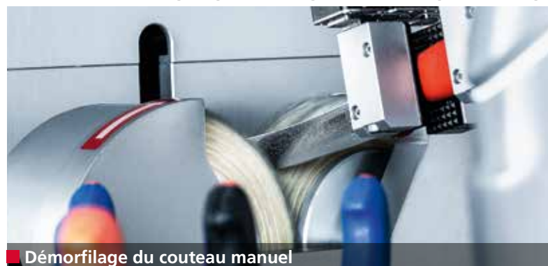
■ Démorfilage du couteau manuel

Les coupes précises optimisent la qualité du produit