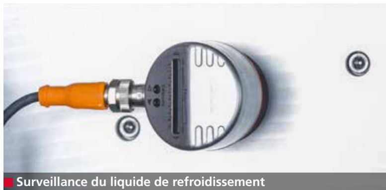
2 Surveillance du liquide de refroidissement

L'unité d'aspiration de série et le système de refroidissement à eau réduisent nettement toutes les émissions générées par les opérations d'affûtage et de polissage. Les voies respiratoires de l'opérateur sont ainsi protégées.