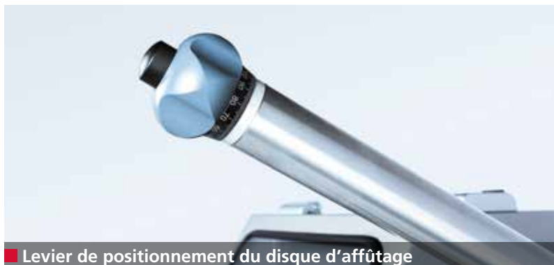
■ Levier de positionnement du disque d'affûtage

L'affûteuse W 200 II assure l'exécution d'affûtages plans et parallèles, une excellente qualité de surface et de hautes performances d'affûtage. Toutes les conditions sont ainsi réunies pour assurer une coupe de haute qualité de la viande. L'objectif est d'obtenir une capacité de coupe constante sur toute la durée de vie des jeux d'outils de coupe.