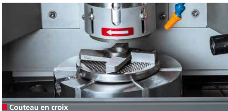
■ Couteau en croix

Le tranchant et la planéité des outils de coupe pour hachoirs à viande, d'affineurs et de hachoirs de remplissage ont une grande influence sur la qualité des charcuteries produites.