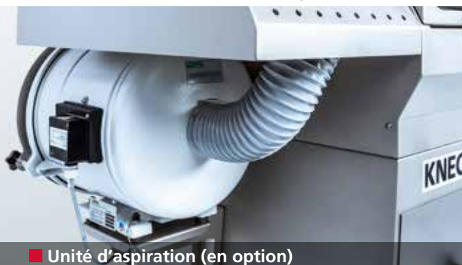
■ Unité d'aspiration (en option)

Chambre de travail hermétique et refroidissement permanent des pièces