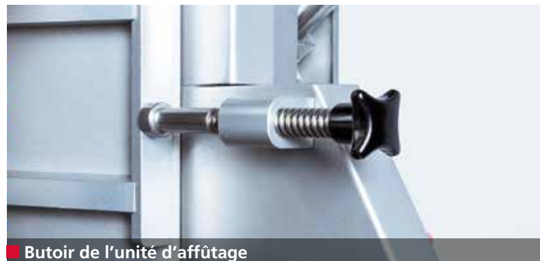
■ Butoir de l'unité d'affûtage

Hautes performances d'usinage, grâce à un entraînement puissant