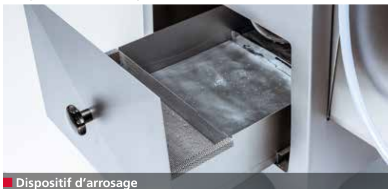
■ Dispositif d'arrosage

L'unité d'aspiration optionnelle permet d'évacuer le brouillard formé par les poussières d'affûtage dans la chambre de travail hermétique. On garde ainsi une très bonne visibilité sur le processus d'affûtage, tout en protégeant les voies respiratoires de l'opérateur.