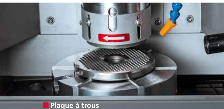
■ Plaque à trous

Une coupe nette grâce à un affûtage optimal