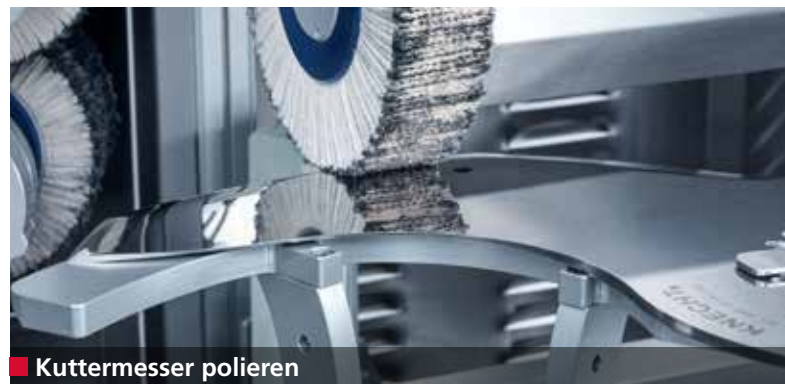
■ Kuttermesser polieren