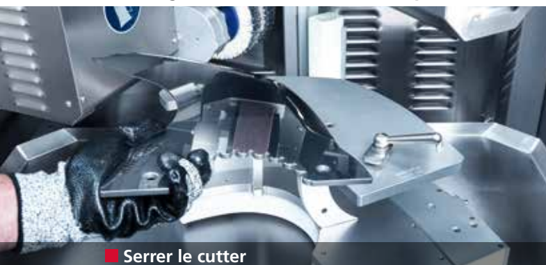
■ Serrer le cutter

Affûtage entièrement automatique des cutters