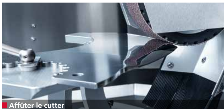
■ Affûter le cutter

Le tranchant, l'angle de coupe, la forme et le profil d'un cutter ont un grand impact sur la qualité des produits traités.