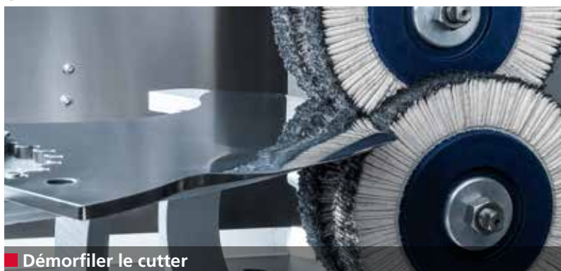
■ Démorfiler le cutter

La B 500 affûte, polit et démorfile automatiquement jusqu'à 100 cutters (500 l) par poste de 8 heures. La moyenne d'affûtage et de polissage par cutter est de 3 à 5 minutes selon sa taille.