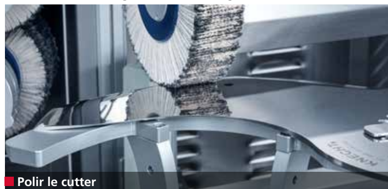
■ Polir le cutter

Polissage et démorfilage entièrement automatiques des cutters