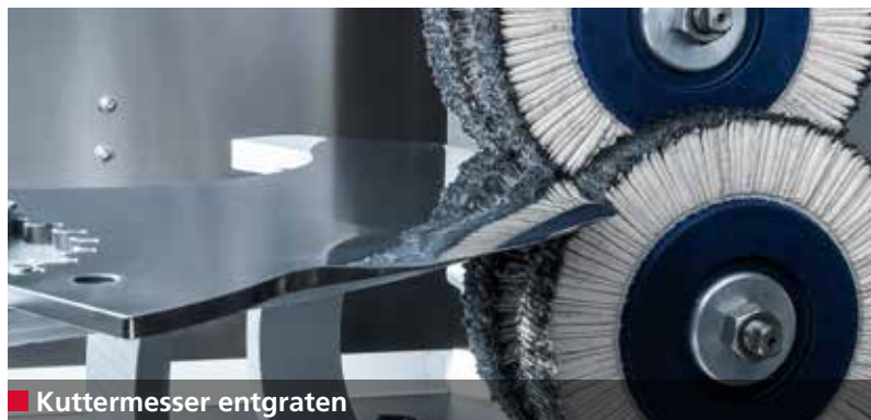
■ Kuttermesser entgraten

Die B 500 schleift, poliert und entgratet vollautomatisch bis zu 100 Kuttermesser (500l) pro 8-Stunden-Schicht. Die durchschnittliche Schleif- und Polierzeit pro Messer beträgt 3 bis 5 Minuten, je nach Messergröße.