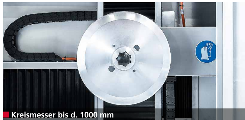
■ Kreismesser bis d. 1000 mm

Die Umrüstung von einem Sichelmesser zum Kreismesser geschieht in kürzester Zeit: