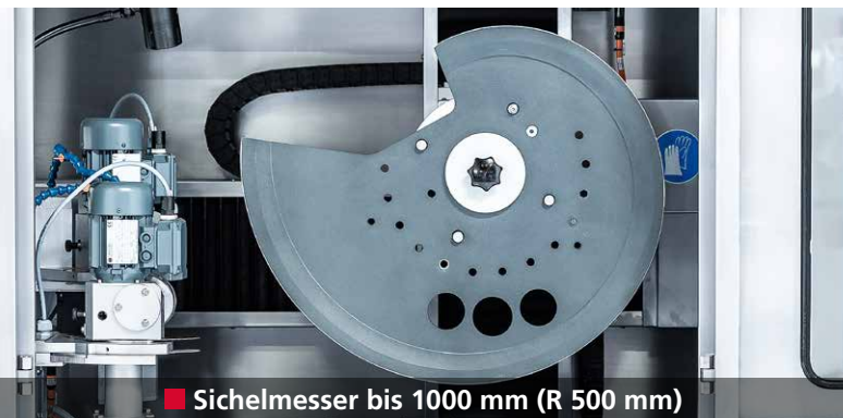
■ Sichelmesser bis 1000 mm (R 500 mm)

Präzise Anschliffe und perfekte Schneidenwinkel durch Servoantriebe