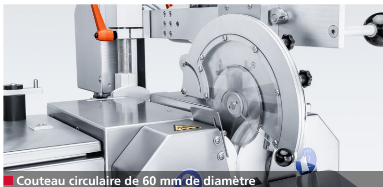
■ Couteau circulaire de 60 mm de diamètre

Le tranchant, l'angle de coupe et la largeur de biseau d'un couteau circulaire ont un grand impact sur la qualité de coupe des produits.